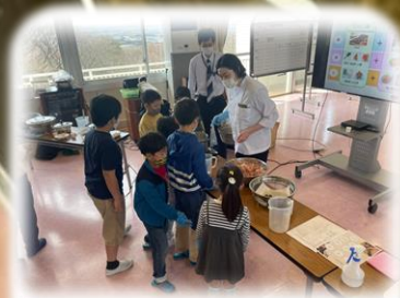
講師：エームサービス株式会社 管理栄養士 https://www.aimservices.co.jp/